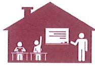
Dans un lieu d'accueil collectif : crèche, chez l'assistante maternelle, école