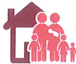
Dans ma famille

J'ai été en contact avec une personne malade de la rougeole, même brièvement