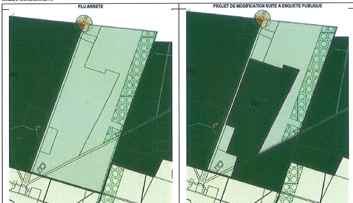
ANNEXE 3 : CARRIERE DU DEFFOI

3. Une correction a également été apportée au plan de zonage à la demande du propriétaire, en raison d'une erreur matérielle sur des parcelles agricoles qui avaient été classées en zone N (naturelle) :